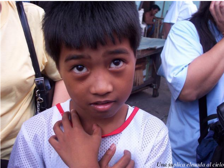
Una suplica elevada al cielo