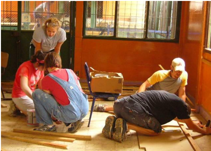
Brigadas de los Estados Unidos construyendo la biblioteca de los Guido y haciendo la escuela de verano para los niños de las comunidades en San Carlos y Desamparados