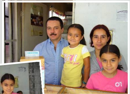
"Un numerito a 25 para ayudar a los niños con hambre"