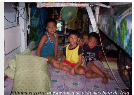
Filipina registra la esperanza de vida más baja de Asia

¡Ayúdenos, a cambiar la vida de los filipinos!