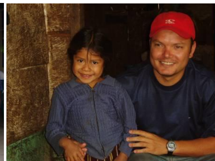
¡Ilusión realizada Juntos!